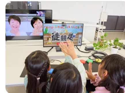
e-sports 体験 (一般社団法人 UDe-スポーツ協会)